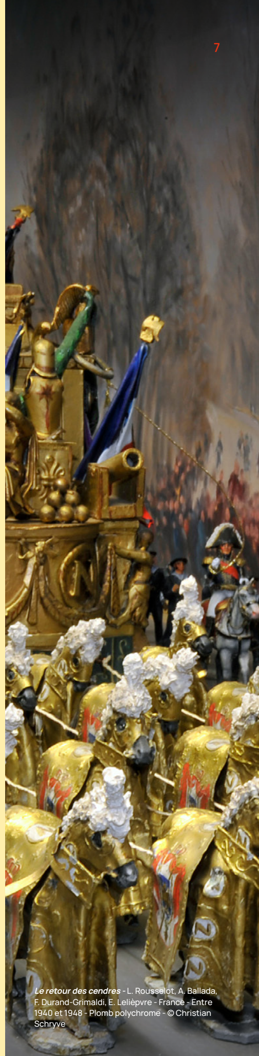
Le retour des cendres - L. Rousselot, A. Ballada, F. Durand-Grimaldi, E. Lelièvre - France - Entre 1940 et 1948 - Plomb polychrome