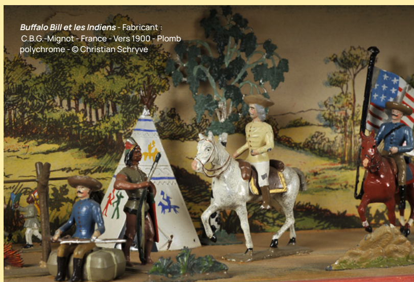
Buffalo Bill et les Indiens - Fabricant : C.B.G.-Mignot - France - Vers 1900 - Plomb polychrome