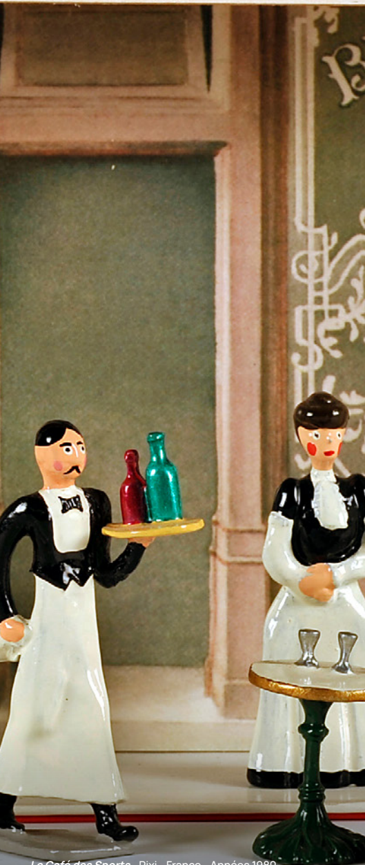
Le Café des Sports - Pixi - France - Années 1980 - Plomb peint - © Christian Schryve