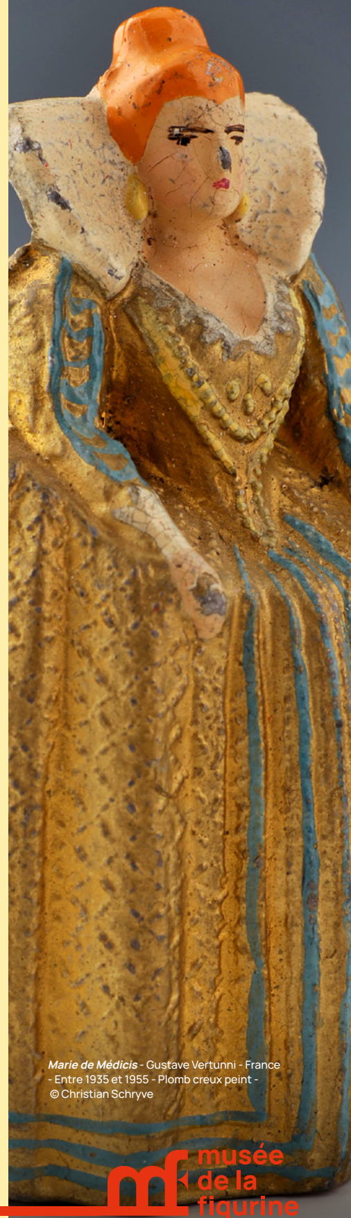
Marie de Médicis - Gustave Vertunni - France - Entre 1935 et 1955 - Plomb creux peint

Réservation obligatoire au 03 44 20 26 04. Toute la programmation à date est à retrouver sur www.musees-compiegne.fr .